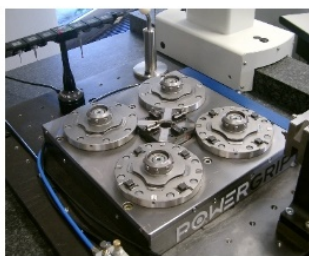
Power-Grip beim Messen