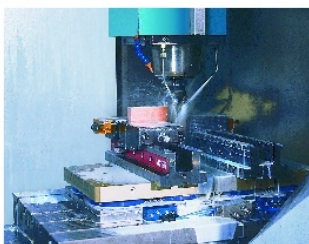
Power-Grip beim Fräsen