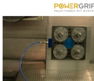
Power-Grip beim Schleifen